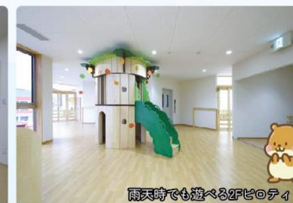
雨天時でも遊べる2Fピロティ