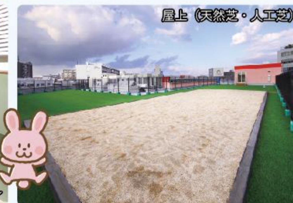
屋上(天然芝・人工芝)