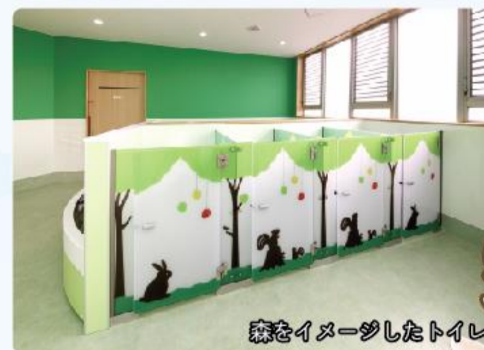
森をイメージしたトイレ